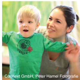
Connex GmbH, Peter Hamel Fotografie